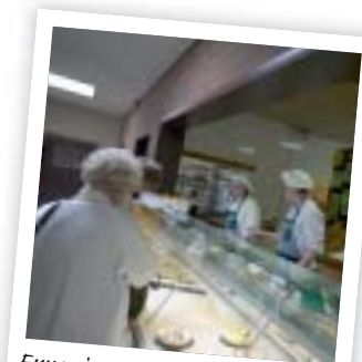
Ervaring met winkelverkoop op school