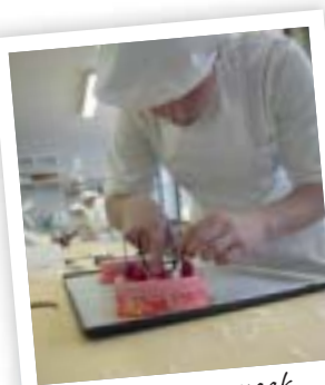
Passie voor smaak