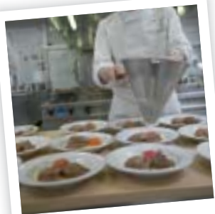
Snel als het moet

Na een opleiding grootkeukenkok wacht het werkveld. Hij of zij die zich echter verder wil bekwamen in de wereld van de grootkeuken kan een 7de specialisatiejaar Gemeenschapsrestaurantie overwegen.