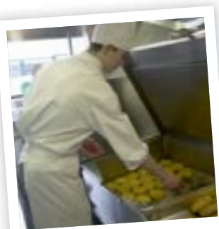
Maaltijden bereiden voor honderden mensen

De studierichting Grootkeuken richt zich vooral op jongeren die zich eerder aangetrokken voelen tot een werksituatie waarin ze ingeschakeld worden in een groter geheel dan tot een individuele gastronomische prestatie. Deze leerlingen hebben in de voorbije jaren ervaren dat zij aanleg hebben voor het keukenwerk. Bij latere tewerkstelling in de sector 'Grootkeuken-Catering', wordt er gewerkt met een vast uur- of weekschema.