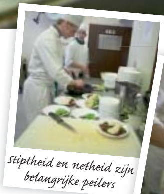
Stiptheid en netheid zijn belangrijke peilers

De opleiding van grootkeukenkok start na de 2de graad (BSO) of Hotel (TSO). Leerlingen met een vooropleiding verzorging/voeding kunnen ook na de tweede graad instappen. Kom je uit een andere richting en je bent gemotiveerd en bereid de ontbrekende ervaringen te verwerven dan wordt de kans op een succesvolle toekomst bijzonder groot.