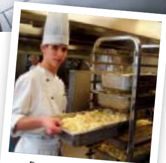
Een grootkeukenkok is meer dan kok