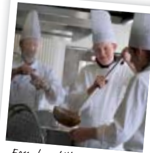
Een dagelijkse uitdaging in team

Voedingstrends en vernieuwende kooktechnieken mogen niet aan zijn aandacht voorbijgaan en krijgen een creatieve invulling in zijn dagelijkse werkwijze. Een grootkeuken-chefkok beheert de grondstoffen, plant, organiseert en geeft leiding in de keuken. Als verantwoordelijke zorgt hij ervoor dat er een gevarieerde voeding wordt aangeboden dat lekker en veilig is. Noties betreffende hygiënische productiemethodes weet hij perfect toe te passen.