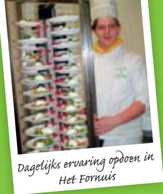
Dagelijks ervaring opdoen in Het Fornuis