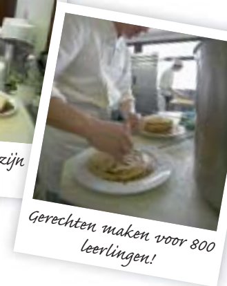
Gerechten maken voor 800 leerlingen!