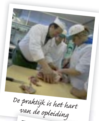
De praktijk is het hart van de opleiding