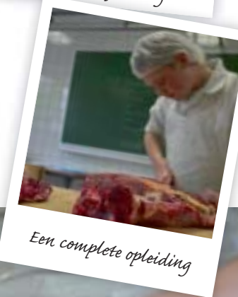
Een complete opleiding