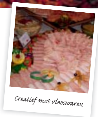
Creatief met vleeswaren

Na de basisopleiding voor slager kan men onmiddellijk aan het werk of kiest men voor een bijkomende éénjarige professionalisering tot slagerfijnkosttraiteur. Ook vanuit andere studierichtingen zoals Hotel en Restaurant/Keuken kent een extra specialisatie succes. De basis vleeskennis wordt verder uitgediept of op peil gebracht. Uiteraard wordt veel aandacht besteed aan de praktijk van de traiteur. Samenstellen en vervaardigen van kant-en-klare maaltijden, hanteren van verschillende gaartechnieken en het bereiden van diverse typen sausen is hier aan de orde. Vleeswaren, vis en groenten leert men op een creatieve wijze samen te stellen tot hapklare gerechten voor de klant. Ook presentatie in buffetvorm voor een feest of barbecue behoren tot het pakket. Het maken van verfijnde charcuterie en de presentatie daarvan in de toonbank of op een feesttafel behoort eveneens tot het kunnen. U merkt het, een opleiding tot Slager - Fijnkosttraiteur is een interessante leerschool. De praktijk en de basiskennis worden aangevuld met heel wat creativiteit en inzichten. Ook de diverse verpakkingswijzen en een kostenbaten analyse komen aan bod. Een Slager - Fijnkosttraiteur leert op de Slagerijschool Ter Groene Poorte het vak, maar ook cijfers te hanteren.