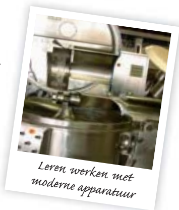
Leren werken met moderne apparatuur

De gespecialiseerde opleiding 'Vleeswarentechnieken' leidt jongeren op die een middenkaderfunctie wensen te bekleden binnen een slagerijomgeving. Via een grondige warenkennis en bedrijfsuitrusting bouwen de leerlingen een diepgaande slagerijkennis op met concrete toepassingen in de praktijk. Tijdens de wekelijkse stage worden de slagerijvaardigheden en -technieken verder uitgediept en dit met aandacht voor het hygiëne- en kwaliteitsgebeuren. Een praktijkleerkracht begeleidt de leerling op zijn stageplaats en bewaakt naast de opleiding de goede samenwerking met de school en het bedrijf. Gespecialiseerde slagerijen hebben een steeds groeiende nood aan mensen die op vaktechnisch gebied sterk staan.