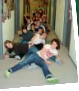
Een toffe thuis