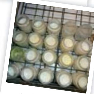
Analyse van stalen