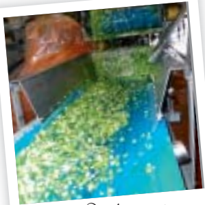
Aandacht voor doorgedreven proceskennis

Assistent Voeding is een specialisatie waarin werkpleklers centraal staat. Als student ga je twee dagen per week aan de slag in een toonaangevend voedingsbedrijf. Deze technische opleiding valt onder de vlag Se-n-Se opleiding (secundair na secundair). Sedert twee jaar biedt Ter Groene Poorte deze unieke studierichting aan. Een éénjarige opleiding die een perfecte aanvulling vormt op de bestaande technische opleiding van bakker, slager of voedingstechnicus. Assistent Voeding is een toepassingsgerichte opleiding met aandacht voor een doorgedreven product- en proceskennis, ethisch en duurzaam ondernemen en waarbij creatieve en organisatorische vaardigheden worden aangescherpt.