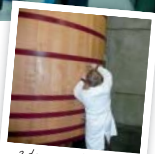
2 dagen werkpleklers per week

Docenten technische vakken fungeren als coach en begeleiden samen met de bedrijfsmentor de student tijdens zijn opleidingstraject. Afgestudeerden kunnen later aan de slag als productieverantwoordelijke, productontwikkelaar, kwaliteitscoördinator, technisch-commercieel medewerker en zelfs als voedingslabo- rant. Kortom, een extra jaar Assistent Voeding schept kansen en biedt mogelijkheden om een veelzijdige en boeiende toekomst binnen de voedingssector tegemoet te gaan. Studenten die nog niet meteen een toekomst op de arbeidsmarkt ambiëren, maar liever verder studeren aan de hogeschool of universiteit zijn degelijk voorbereid en vergroten hiermee hun kans op succes.