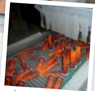
Je verwerft inzicht in productieprocessen

Later instappen in de opleiding kan het best vanuit de opleidingen: