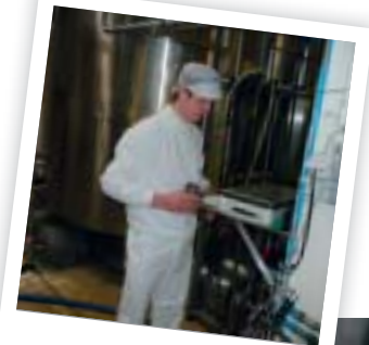
Stage op de werkplek

7de jaar: 2 dagen werkplekleren + 4 weken blokstage