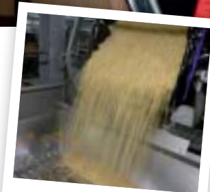
Het volgen van een productielijn